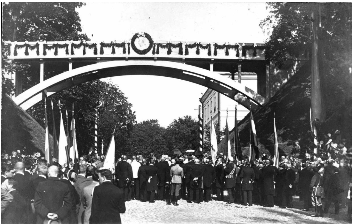
Торжественное открытие моста Александра I.