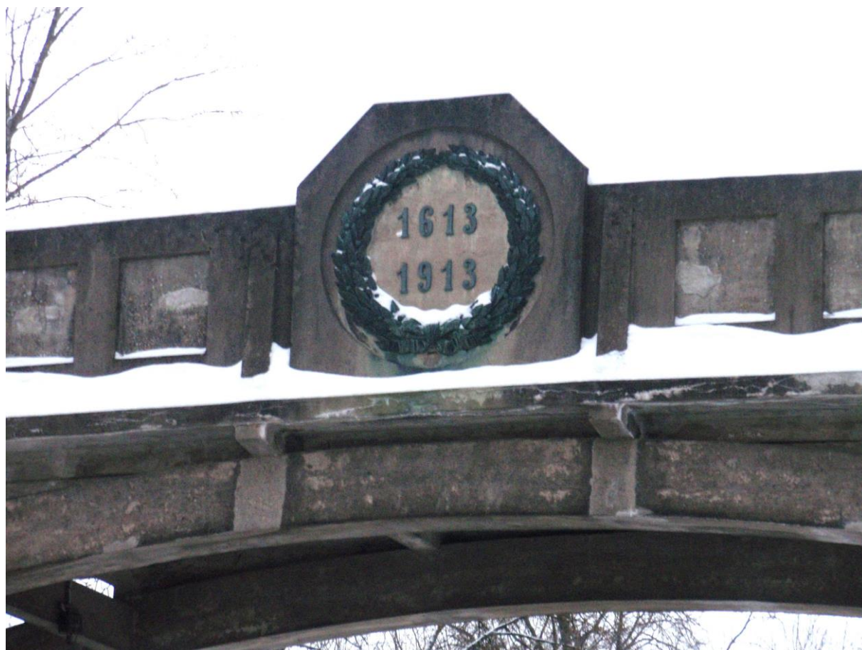
Мост Императора Александра I – январь 2013 года.

Думаю, что сейчас, когда недалеко новая круглая дата, подходящее время подумать, как надлежащим образом отметить юбилей.