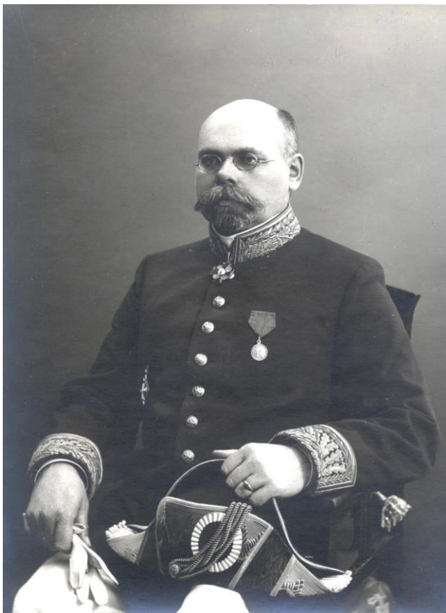
Виссарион Григорьевич Алексеев.