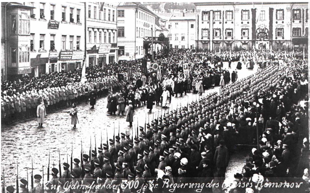
Празднования 300-летнего юбилея Романовых в Тарту.

«Уже со среды город в праздничном облиции. Городская ратуша, равно как и другие здания в центре города украшены еловыми венками и флагами. На витринах магазинов картины и бюсты государя и государыни. Кругом красно-сине-белый цвет ... В четверг уже с 9 часов утра улицы полны народа. К полудню на парадную площадь прибыла местная воинская часть. За ними шагали гимназисты, городская школа со своим музыкальным хором, ученики начальных школ, пожарные команды, а также студенческие организации со своими флагами. У ратуши прошел молебен по Греко-католическому стилю. Затем объединенный музыкальный хор школьников, военных и пожарников исполнил государственный гимн, покинув затем парадную площадь церемониальным маршем.